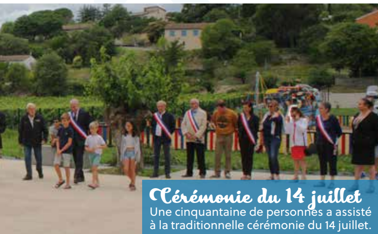
Cérémonie du 14 juillet Une cinquantaine de personnes a assisté à la traditionnelle cérémonie du 14 juillet.

Les pompiers villadéens ont été très sollicités pour des renforts cet été dans le Var, les Bouches du Rhône, Perpignan, la frontière espagnole, Nîmes, la Corse et même en Guadeloupe pour l'un d'entre eux.